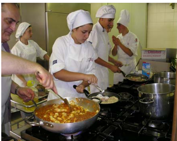
Formazione integrata: cucina