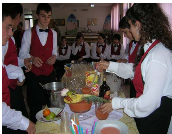
Formazione integrata: sala e bar