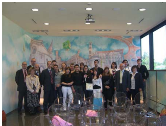
Stage in azienda: la banca