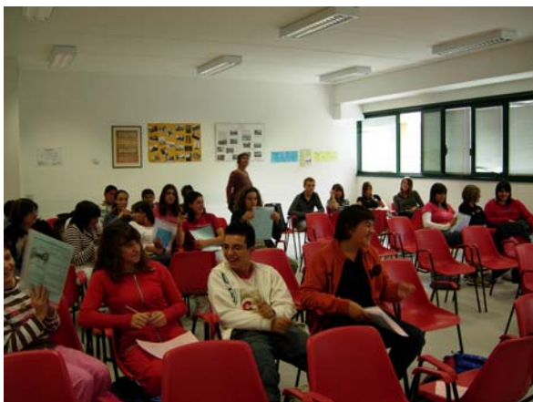
Attività di accoglienza